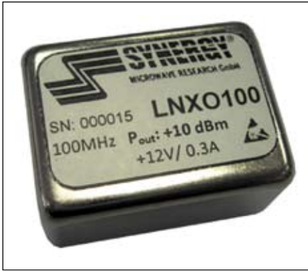
Рис. 2. Внешний вид LN XO100

просу производитель может сделать отбор по требуемым заказчику характеристикам (включая отчет по значениям фазовых шумов для конкретного прибора). Подавление гармонических составляющих на выходе генератора (до уровня -30 дБс и лучше) обеспечивает спектральную чистоту выходного сигнала.